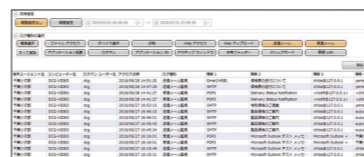
操作ログ(送信メール/受信メール)画面